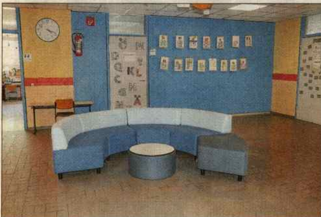
Das neue Flurmöbilar passt farblich perfekt.

Grund zur Freude haben die Schülerinnen und Schüler der Grundschule Reimsbach. Für knapp 12.000 Euro wurden neue Flurmöbel beschafft. Nachdem diese aufgebaut worden waren, konnten die Kinder das neue Mobiliar natürlich direkt ausprobieren. Die stattliche Summe für die Anschaffung der Flurmöbel wurde vom Förderverein der Grundschule Reimsbach mit 6500 Euro und von der Gemeinde Beckingen mit einem Zuschuss von 5000 Euro gestemmt.